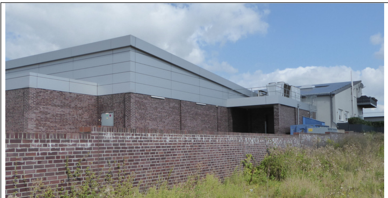
Abb. 3: geklinkerter und metallverkleideter Kontaktbereich des Lidl-Marktes

Der bestehende Kontaktbereich des Lidl-Marktes ist geklinkert und im oberen Teil auch metallverkleidet und weist keine Zwischenräume und -decken auf. Der Kontaktbereich wurde von außen auf Nester und Nistgelegenheiten für Vögel und die potenzielle Nutzbarkeit durch Fledermäuse untersucht.