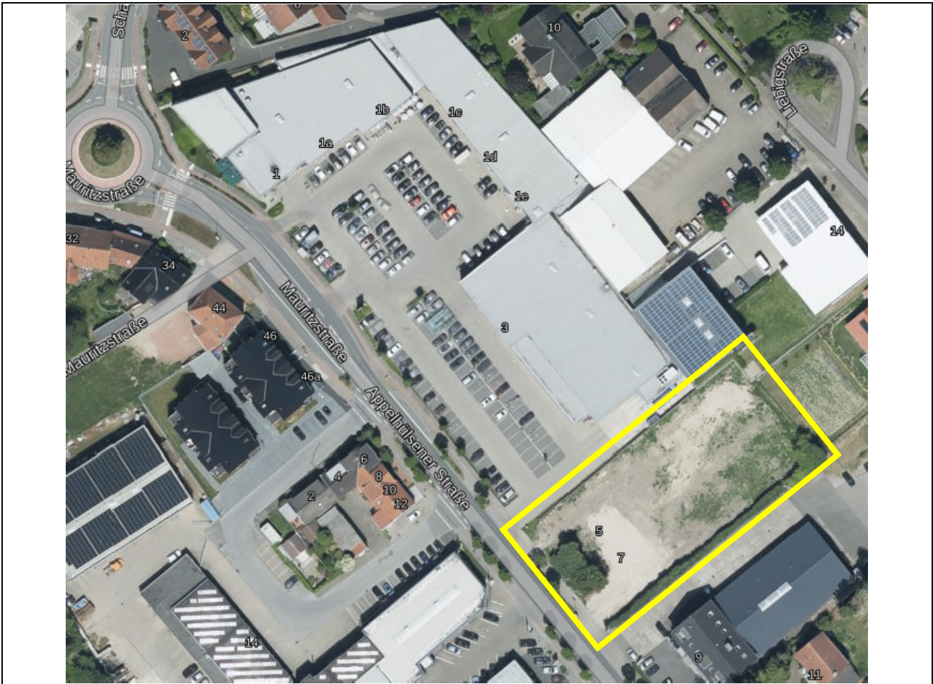
Abb. 2: Erweiterung Fachmarktzentrum - Lageplan

gelbes Rechteck = geplante Erweiterung