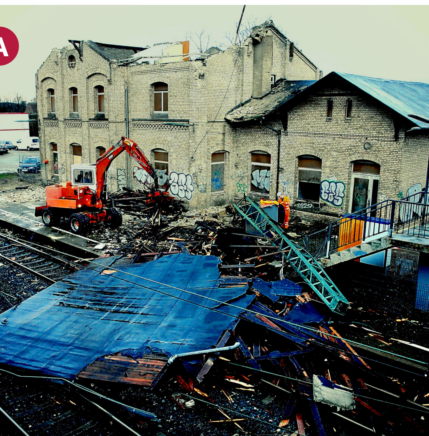
Schäden am Bahnhof Appelhülsen durch den Orkan Kyrill