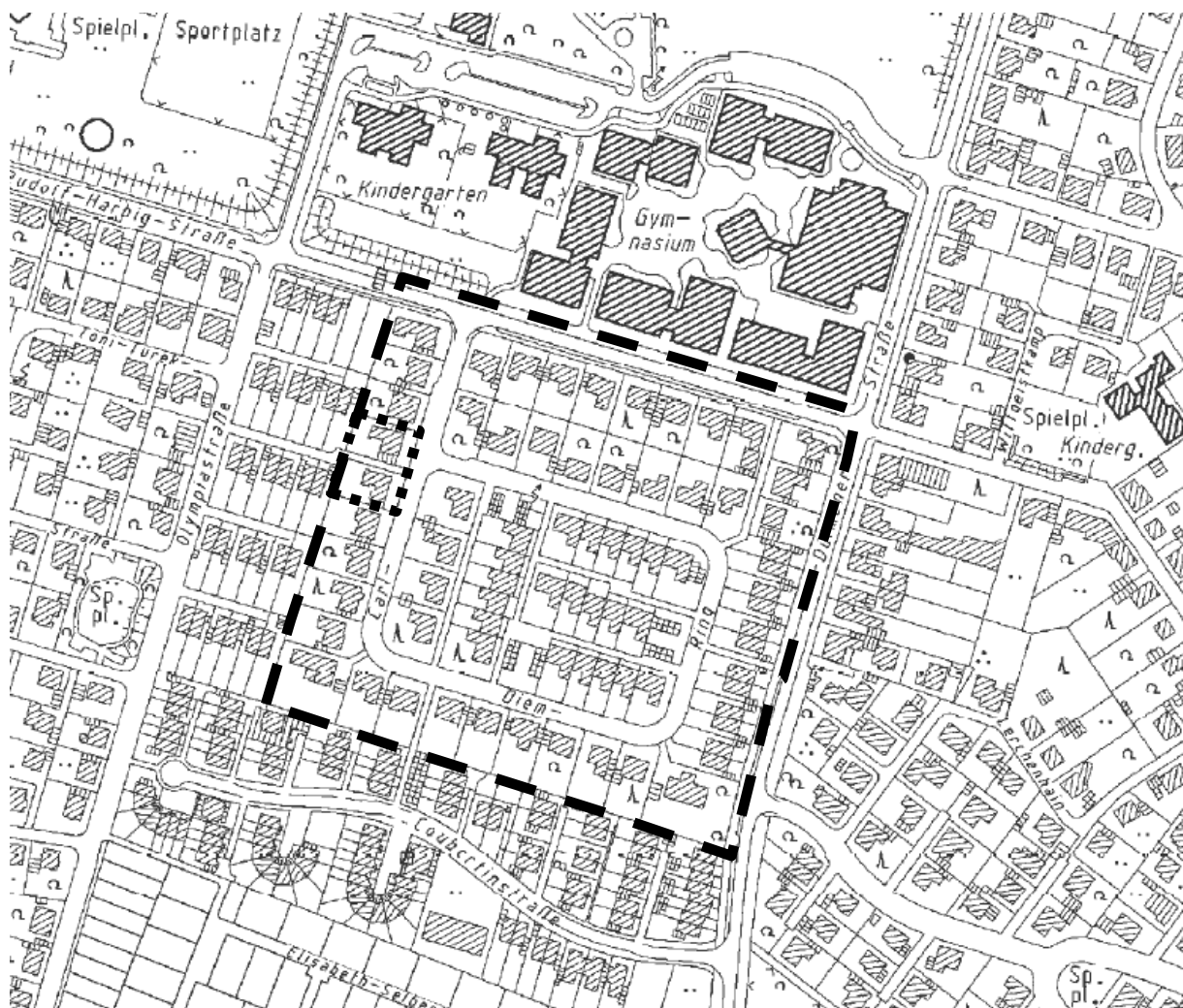
Übersichtsplan (ohne Maßstab)

Der Änderungsbereich befindet sich im äußersten Westen des Geltungsbereichs des Bebauungsplanes, am Fußweg zwischen dem Carl-Diem-Ring und der Jahnstraße/Olympiastraße. Die Abgrenzungen sind der nachstehenden Übersichtsskizze zu entnehmen.